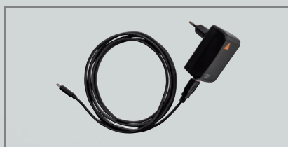
E4-USBC strömförsörjning via kable [04]