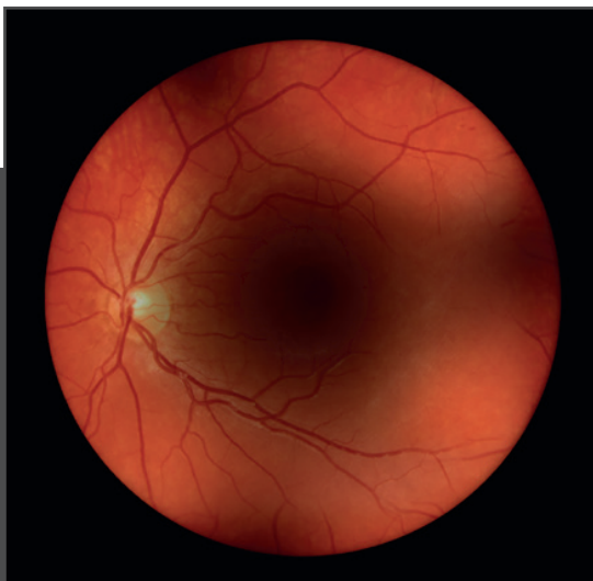
Vanlig vy av en näthinna genom en katarakt*