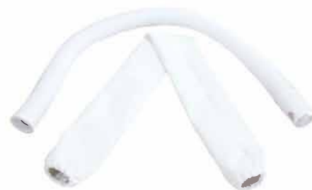
Slang + läderfodral