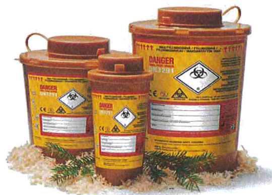
LCA - WoodSafe® vs PP